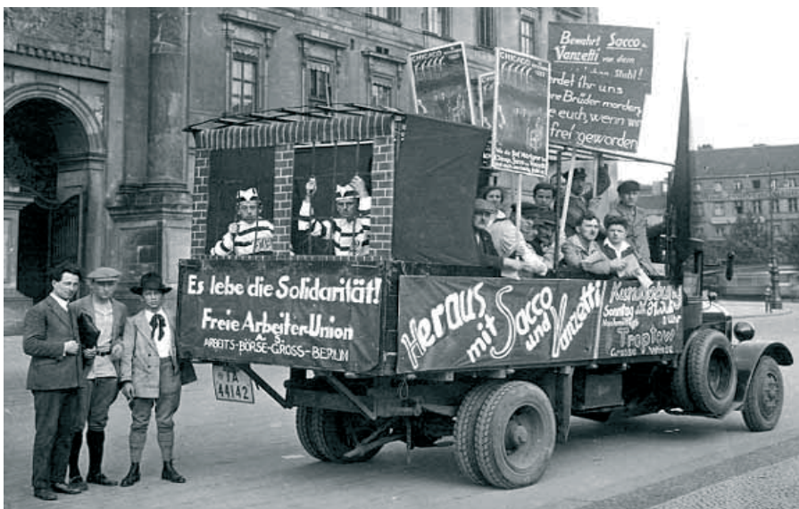
Augustin Souchy (prvý zľava) sa podieľal na solidárnej podpore anarchistov Nicola Sacca a Bartolomea Vanzettiho, ktorí boli od roku 1920 väznení v USA. V roku 1927 boli po celosvetovo známom vykonštruovanom súdnom procese popravení.

Spolu s Rudolfom Rockerom a ďalšími patrili do berlínskej Pracovnej komisie FAUD a podieľal sa aj na spájaní anarchosyndikalistických organizácií do Medzinárodnej asociácie pracujúcich (MAP), ktoré inicioval Rocker. Išlo o medzinárodnú „protiváhu“ bolševickej Červenej odborovej internacionály (Profinterny). Počas tohto obdobia sa spoznal s mnohými anarchistami z rôznych krajín, ktorí v Berlíne hľadali útočisko. Okrem iného to boli ruskí anarchisti, ktorí utiekali pred bolševikmi, či španielski anarchisti (napríklad aj Durruti), ktorí unikali pred represiou. Po páde monarchie v roku 1931 podnikol Souchy v mene MAP niekoľko ciest do Španielska. V liste Emme Goldman z roku 1936 píše: