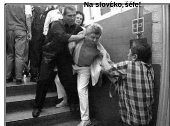
Na slovko, sefe!

a skandujúc „Už ideme po zlodēja!“ vrazili dnu. Podľa prítomných novinárov mal riadiť hrubo urážať lodiarov, ktorých to vytycilo. Strhli zneho sako akošelu, vyvliekli pred budovu na traktore abádzali po nom vajčka (starý ľudový zvyk spojený so zbavovaním sa pánov). Potom ešte dostal rany pástami a kopance a podarilo sa mu utiecť. Za tento pôsobivý cin bolo zatknutých päť lodiarov. Výbor samozrejme vyjadril ľútosť nad „incidentom“. AF/IP od začiatku kritizuje taktiku vyjednávaní. Medzi akcie, ktoré robili patri