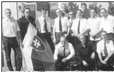
Upravení mladíci z NSS - neonacizmus v košeliach a kravatách

Co je horšie, v mnohých mestách sa stáva to, že aj mladi ľudia, ktorí sa zaujímajú o myšlienky sociálnej spravodlivosti (i keď zo začiatku skôr o alternatívnu kultúru, ktorou ale prešli aj viaceri znás) sa k neonacizmu stavajú dosť lahostajne. Pokiaľ je ich málo, tak sa z nich smejú, ignorujú ich a majú plné ústa antifašizmu. Keď je ich viac a neonacisti im obsadia obľúbenú krcmu, nájdú si inú. Ak obsadia aj tú, skúsia to inde. Keď zbijú prvého z nich, postavia sa k nemu chrptom alebo vinu zvalujú na neho samotného („zbytočne si provokoval“). Ak je náckov viac ako ich samotných a majú problém nájsť si večer podnik, kde