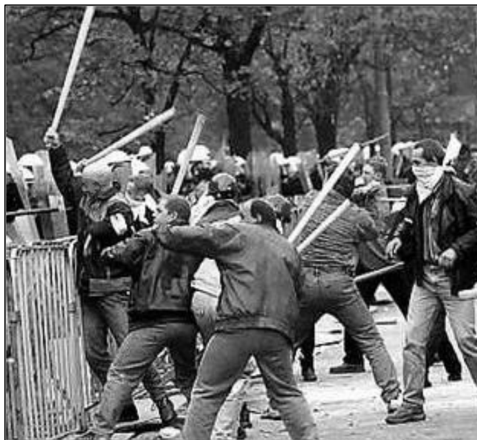
Banici z odborov Solidarita '80 na demonštrácii vo Varšave.