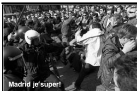
Madrid je super!