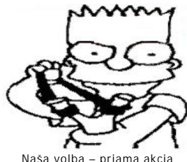
Naša volba – priama akcia