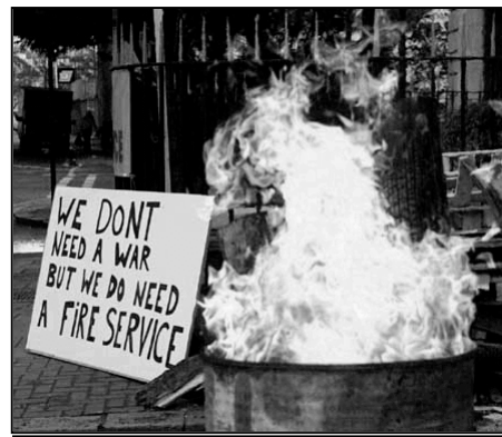
„Vojnu nepotrebujeme, požiarnú službu áno“, hovorí piket požiarnikov.